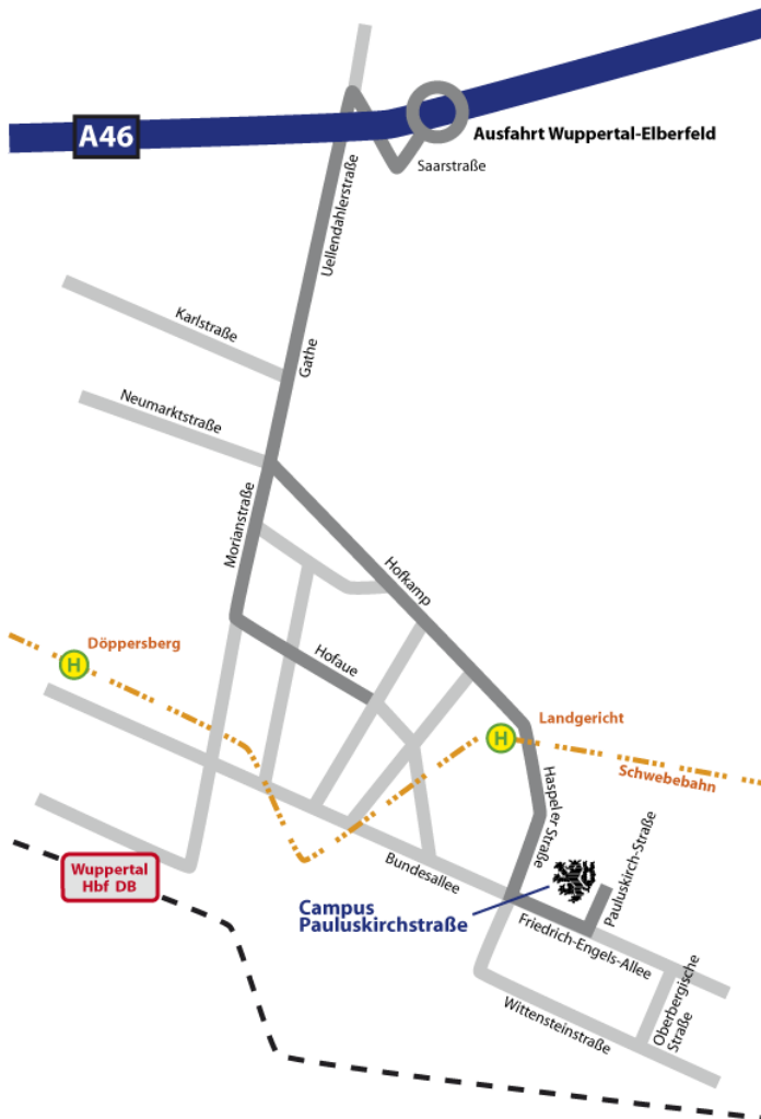
Autobahnabfahrt Campus Haspel